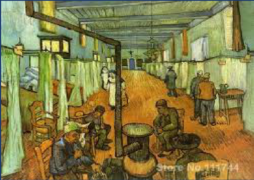
Vincent van Gogh, La salle des malades de l'Hôpital d'Arles .