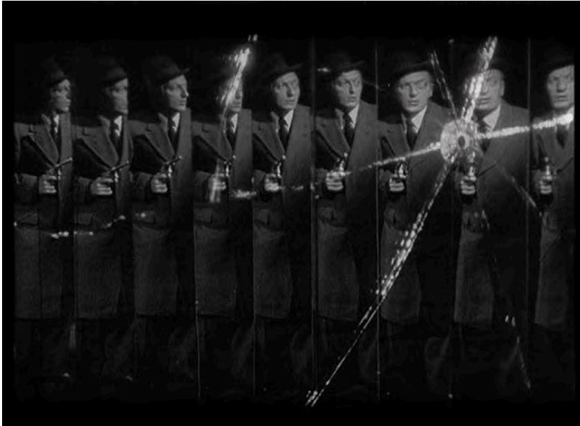
La dame de Shanghai , d'Orson Welles, scène du palais des glaces.